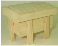
唐櫃 桐製 足つき