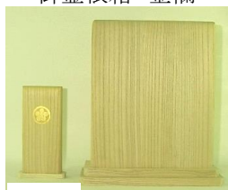
桐製 桐製 教会用