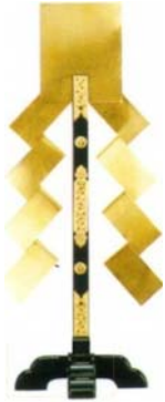
金幣 切下型 十字