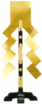
金幣 切下型 十字台