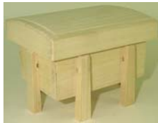
唐櫃 桐製 足つき