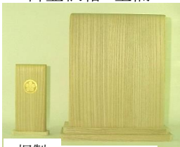
桐製 桐製 教会用