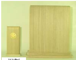
桐製 桐製 教会用