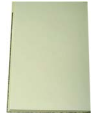
教会用 字入 教会用 無地