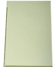
教会用 字入 教会用 無地