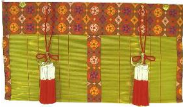
新倭錦(しんやまとにしき)