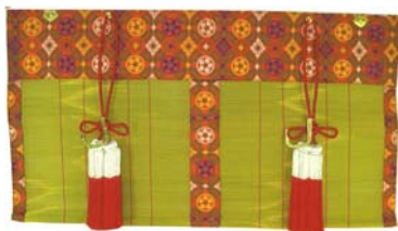
新倭錦(しんやまとにしき)